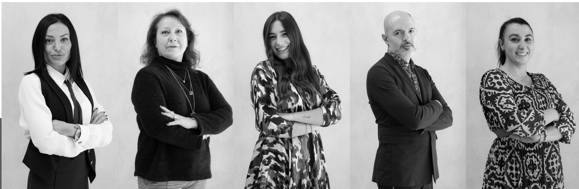
Ada Lo Prejato Commerciale